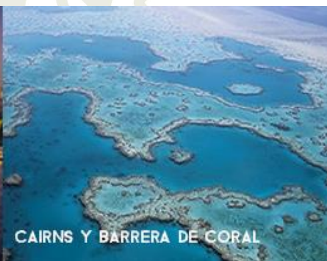
CAIRNS Y BARRERA DE CORAL